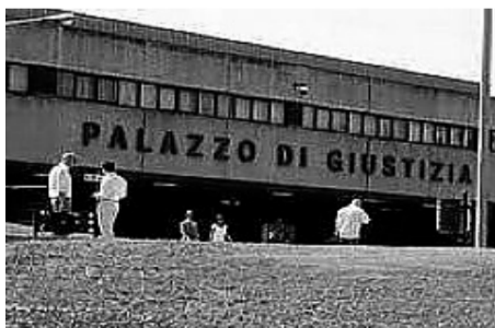
I legali del sindacato sono già al lavoro per preparare il ricorso

Gilda presenterà un ricorso al Tribunale del lavoro Il sindacato spalleggia gli insegnanti bloccati